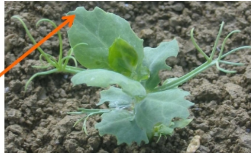
Morsures de sitones sur pois

Seuil de nuisibilité : 5 à 10 encoches au total sur les premières feuilles.