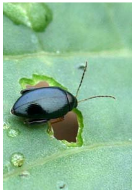
Altise : dégâts sur cotylédons et jeunes feuilles

Etre très vigilant sur ce début de cycle en ce qui concerne limaces et altises . En effet, les attaques limitent encore plus la croissance que celle du mois de septembre.