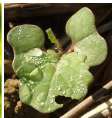
Limace : dégâts sur cotylédons et jeunes feuilles