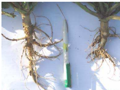
Photo : pivot de droite de moins de 15 cm de long : enracinement limitant (photo C. Vogrincic, janvier 2010)

Les qualités d'enracinement ont été assez fréquemment limitantes : la présence de pivots bloqués ou coudés était parfois la conséquence des mauvaises conditions d'implantation de la céréale à paille précédente lors de l'hiver 2008-2009 avec un ressuyage insuffisant des sols.